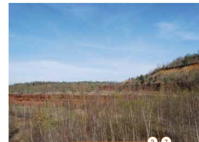
2 7 Vue des différentes couches