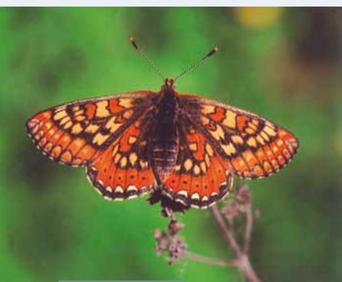
Le Damier de la succise