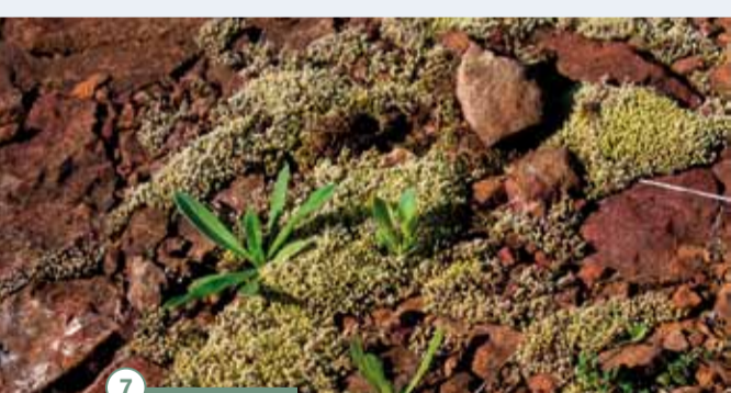
7 La succession