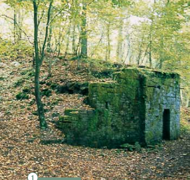
1 Le plan incliné