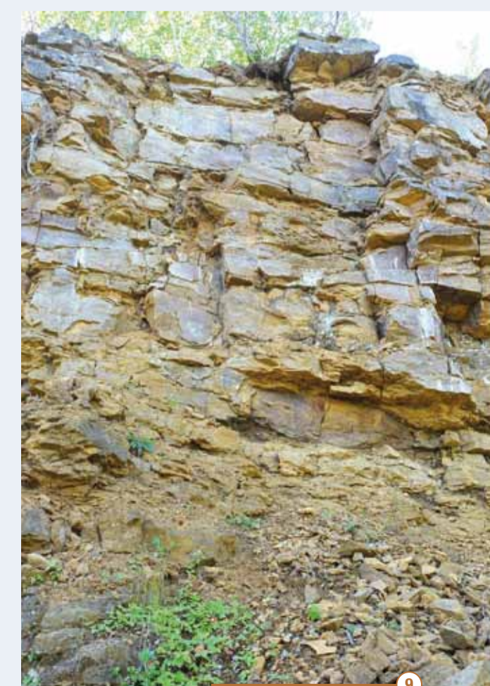
9 Le «calcaire de Haut-Pont»

Attention! Ne vous approchez pas des falaises rocheuses, certains fragments peuvent se détacher sous vos pieds.