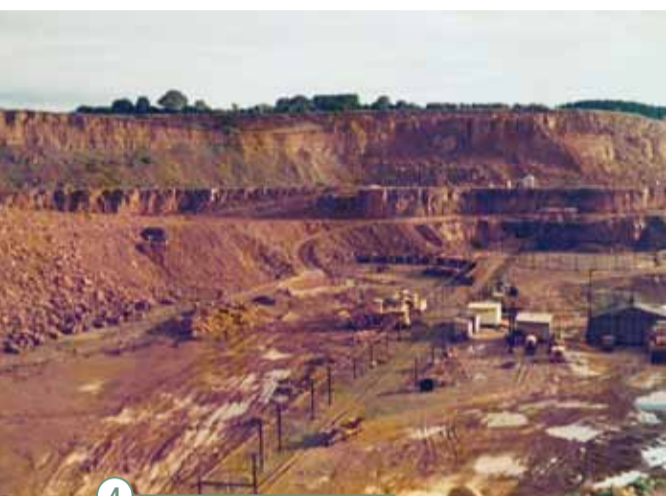
4 L'exploitation à ciel ouvert