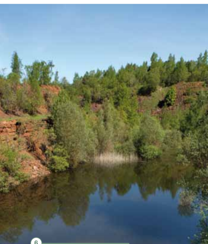
6 La zone humide et ses mares