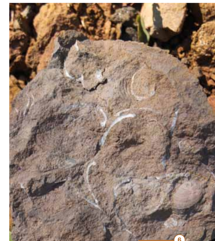
6 Les fossiles